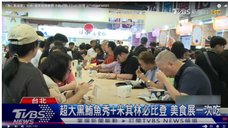
美食展開幕 賴總統讚各族群交流創新台灣味