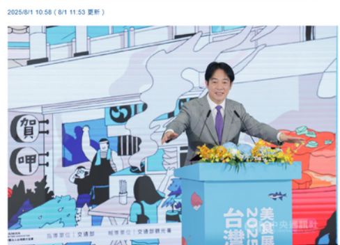
總統賴清德（圖）1日在台北世貿1館出席2025台灣美食展開幕典禮致詞時表示，台灣是多元社會，各族群都有代表性美食，彼此交流創新激盪出共同滋味，就是台灣味。 114年8月1日